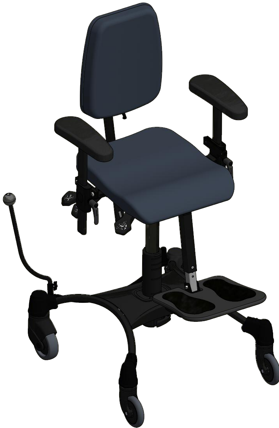
VELA Tango 100 S