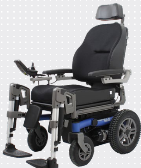
VELA Sango med bakhjulsdrift

Stolen kan ta sig runt på smala ställen och ger plats för en 90° vinkel av benen.