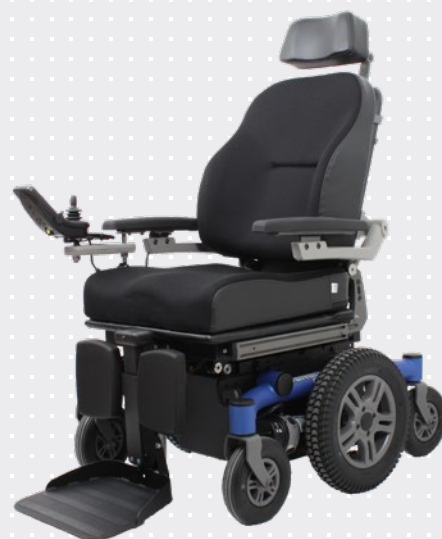
VELA Sango med centerdrift

Stolen är väldigt riktningstabil med hög hastighet.