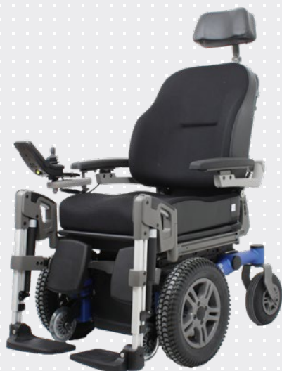
VELA Sango med framhjulsdrift

Stolen kan ta sig runt på smala ställen och ger plats för en 90° vinkel av benen.